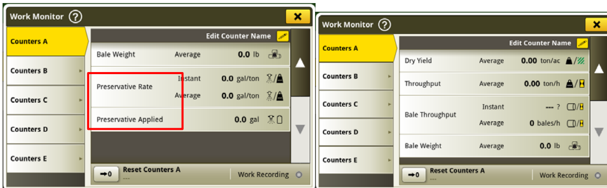
Visible vs. masqué